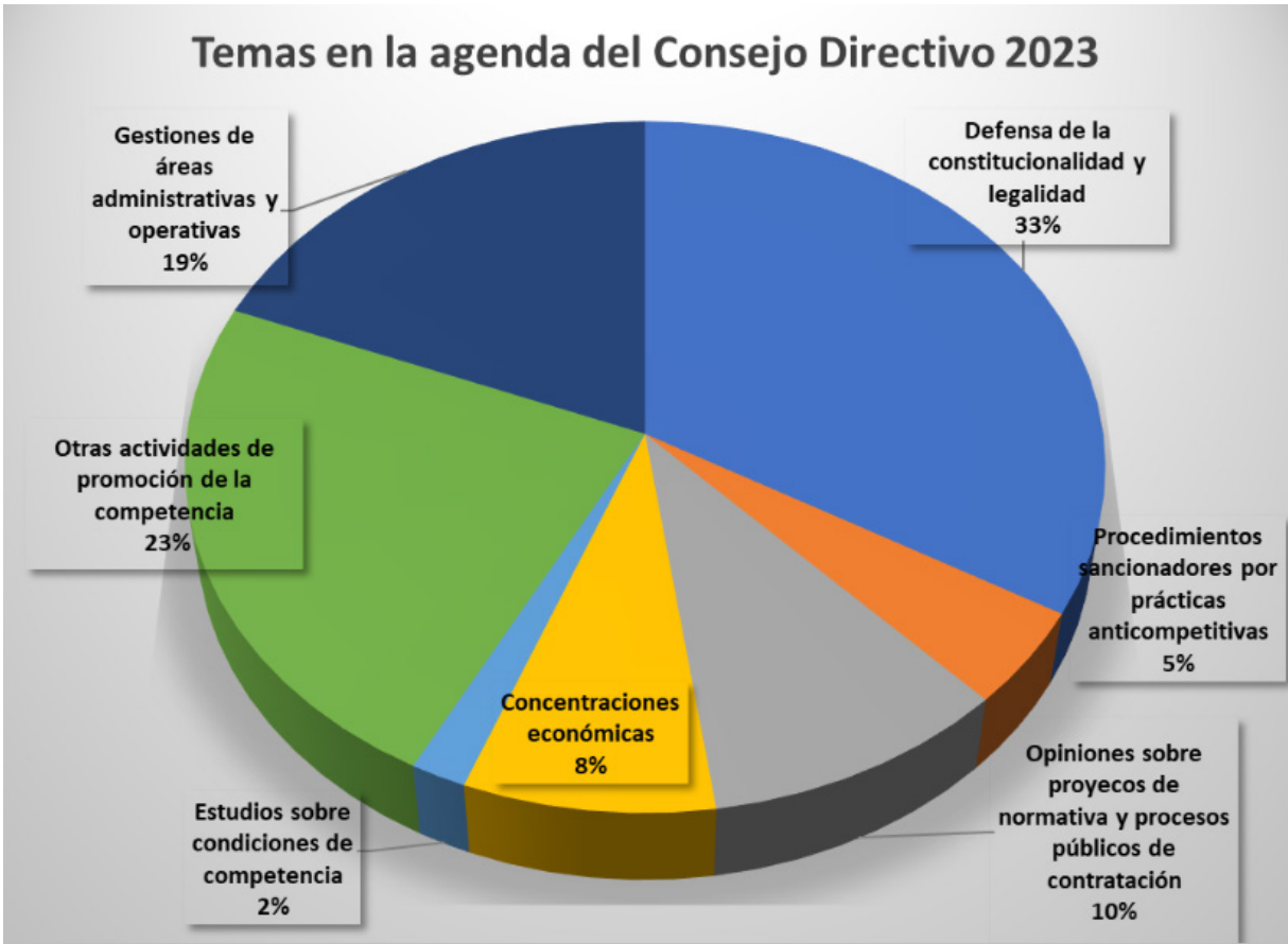
Gráfico 2. Temas del Consejo Directivo

A lo largo del presente informe se detallarán las actividades que el Consejo Directivo desarrolló, con base en las facultades otorgadas por la Ley, las cuales se materializaron en las respectivas resoluciones, opiniones, informes, etc., que se reflejan en las actividades reportadas por las Intendencias y unidades de esta institución.